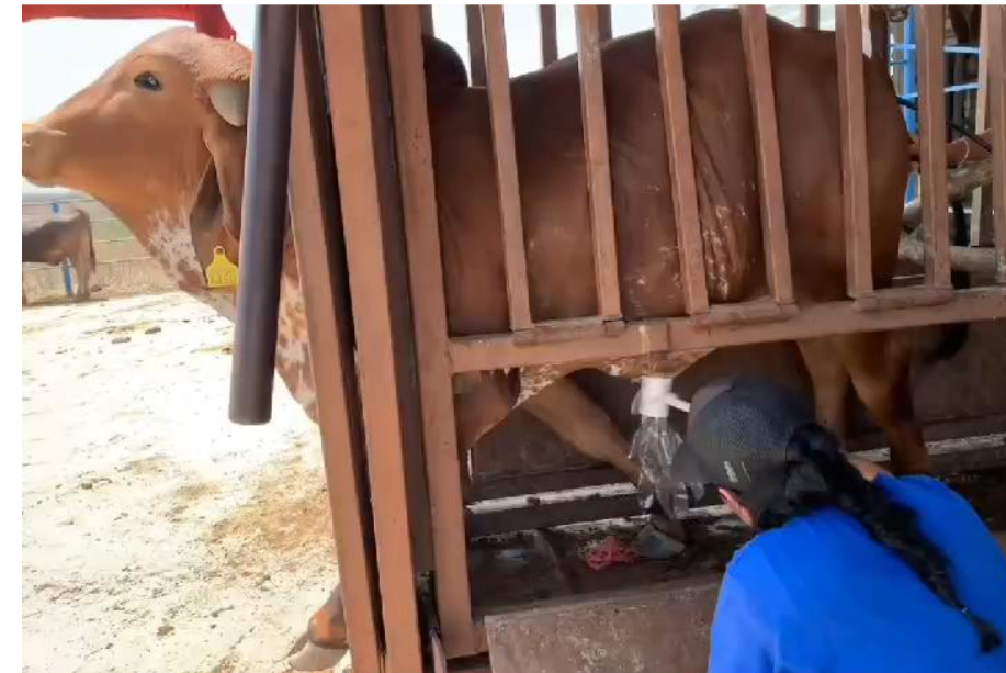
EVALUACION DE SEMENTALES