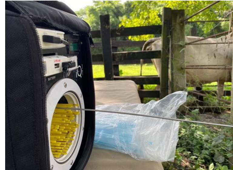
T.E (TRANSFERENCIA DE EMBRIONES)