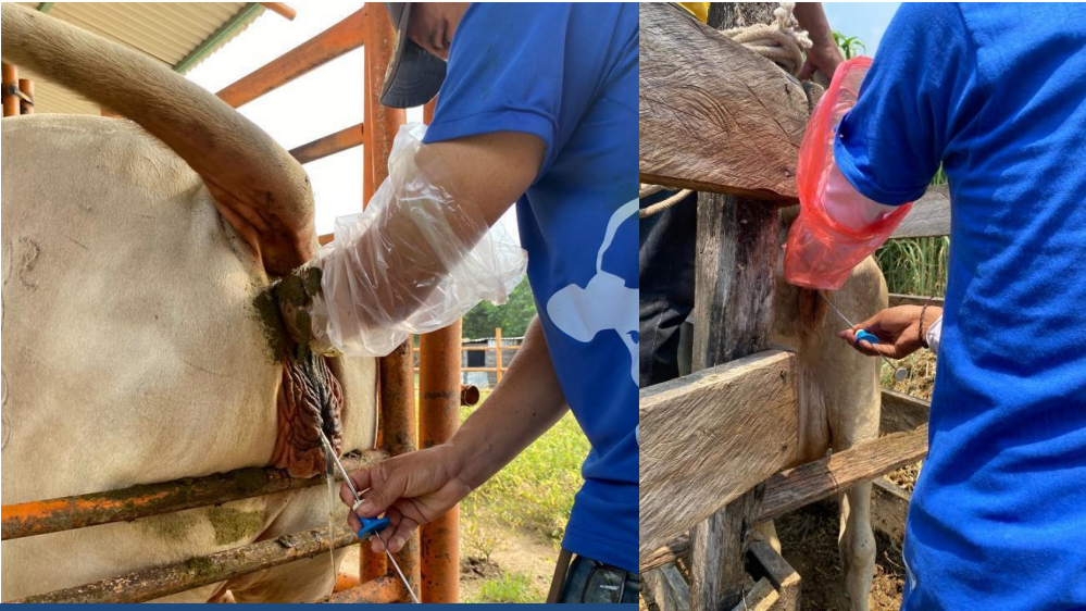
I.A.T.F (INSEMINACION ARTIFICIAL A TIEMPO FIJON)