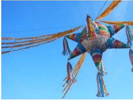
La piñata: espectáculo familiar en las fiestas mexicanas.