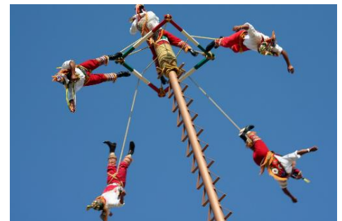
Ritual d ellos voladores: Su ejecución se remonta a los rituales religiosos indígenas, se cree que es un ritual para la fertilidad.

Una rica y complicada gama de costumbres, fiestas, tradiciones y creencias conviven de manera increíble en Chiapas, pues cada uno de los grupos étnicos que allí habitan posee hondas raíces y tradiciones cuyos orígenes, en algunos casos, se pierden en el tiempo y en los recónditos secretos de la historia de sus más antiguos ancestros: los mayas de la época Clásica