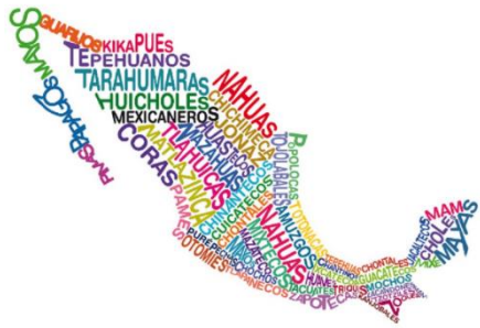
Idiomas de México