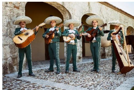
Mariachis: conjunto musical que comúnmente anima fiestas y bodas. Patrimonio Cultural Inmaterial de la Humanidad.