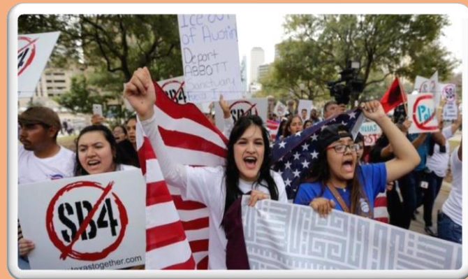
Leyes anti-inmigrantes se propagan en EEUU; ¿un golpe al 'sueño americano'? - Los Angeles Times

1e2a2a32b2b875b11de59526156b15bf-LC-LPS 602 PROCESOS CULTURALES.pdf (plataformaeducativauds.com.mx)