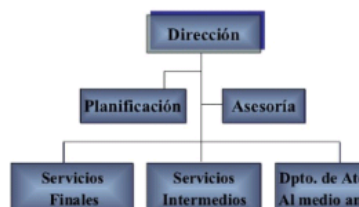
ESTRUCTURA LINEAL - STAFF

Nueva figura: Staff. Está formado por personas o departamentos, que asesoran a los empleados y no dan órdenes directas, sobre quienes forman la línea, sino que esencialmente les asesoran, y en todo caso realizan determinadas funciones especializadas. Se basa en el principio de especialización funcional (I+D, investigación de mercados, calidad).