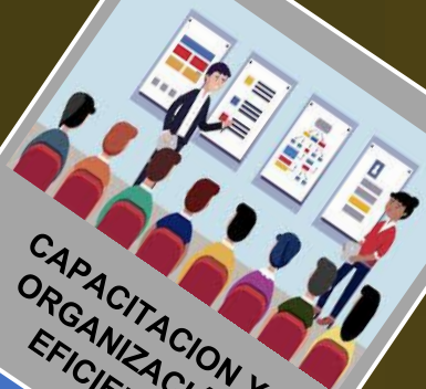
CAPACITACION Y ORGANIZACION EFICIENTE

Conocer el proceso de gestión social para lograr una capacitación y organización eficiente y eficaz que lleve al desarrollo de la comunidad.