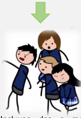
Incluyen dos o más entrevistados.