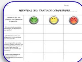
Lista de control