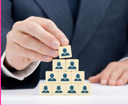
"La comunicación organizacional" https://blog.hubspot.es/marketing/comunicacion-organizacional