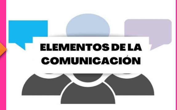
"Los elementos de la comunicación organizacional son esenciales para que el proceso se cumpla." https://blog.hubspot.es/marketing/comunicacion-organizacional