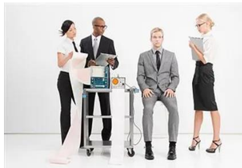
Fuente: Método experimental