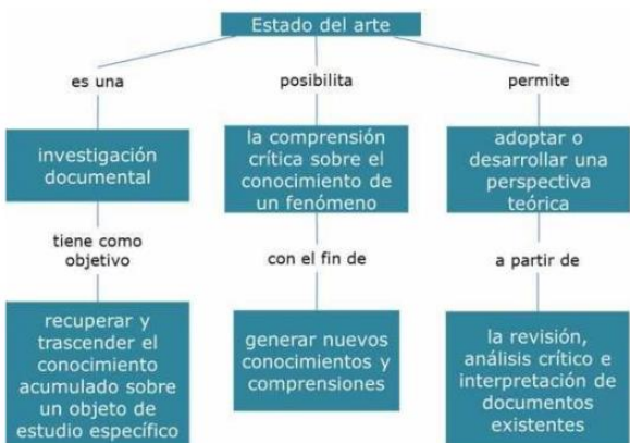
Figura 4: Concepto de Estado del Arte desde los objetivos principales

❖ Identificar vacíos o necesidades referidas a la producción documental en el campo del saber objeto de investigación.