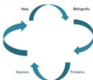
Figura 3. Un Estado del Arte exige una revisión constante.

La pretensión de todo Estado del Arte es construir los antecedentes a partir de ellos mismos; realizar un sondeo descriptivo, sinóptico y analítico; alcanzar un conocimiento crítico y una comprensión de sentido de un tema específico;