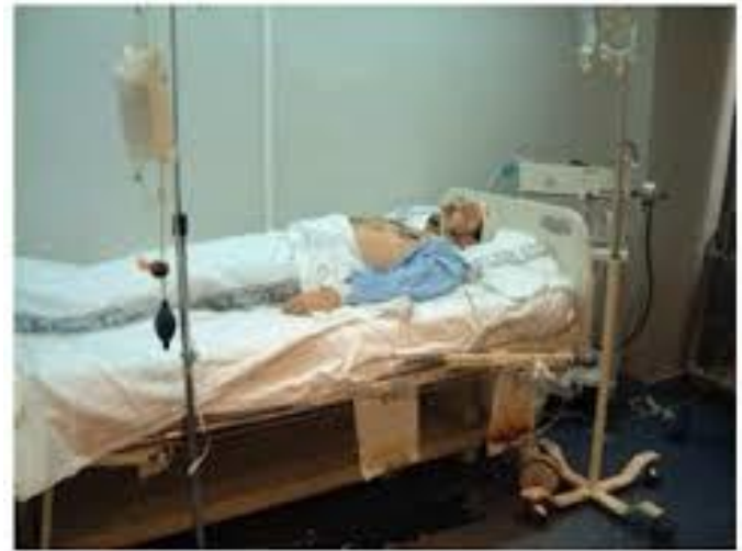
4.- Paciente en estado terminal.