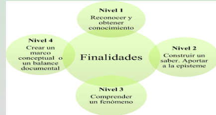
Finalidades del estado del arte Obtenido de: Finalidades del estado del arte. Fuente: elaboración propia. | Download Scientific Diagram (researchgate.net)