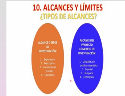
Alcances y límites Obtenido de: (143) 10 Alcances y Límites - YouTube

El alcance de un Estado del Arte es la definición de los aportes que alimentan las investigaciones existentes y, por ello, se recomienda tener en mente y de manera previa las siguientes preguntas