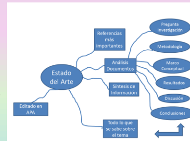
Aplicando el Estado de Arte Obtenido de: Estado del Arte en el Proceso de Investigación - Blog de Investigación, Ciencia y Tecnología (investigacion360.com)

Es importante sumar a los límites antes anunciados, las diferencias en los estilos de escritura, fundamentalmente cuando se trabaja de manera colaborativa y se hace necesaria la escritura de textos con la intervención de más de dos manos.