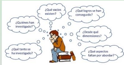
Mendely y estado de arte

Es la construcción de su Estado del Arte, ya que permite determinar la forma como ha sido tratado el tema, cómo se encuentra el avance de su conocimiento en el momento de realizar una investigación y cuáles son las tendencias existentes en ese momento cronológico, para el desarrollo de la temática o problemática que se va a llevar a cabo.