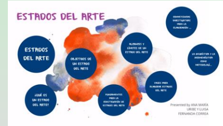
Estas del arte

Lo que se pretende al construir Estados del Arte, es alcanzar un conocimiento crítico acerca del nivel de comprensión que se tiene de un fenómeno específico,