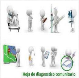
Hoja de diagnostico comunitario