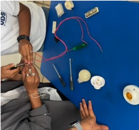
Realizando un circuito en paralelo.