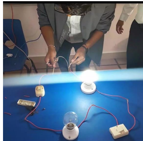
Se realizo circuito en serie y paralelo.