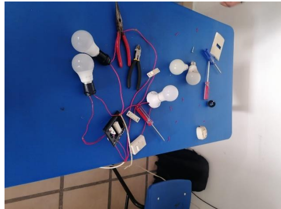
Se realizo un circuito en serie con 3 focos.