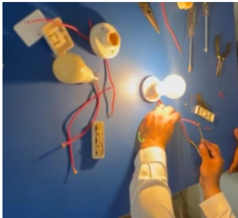
Se realizo circuito en serie y paralelo.