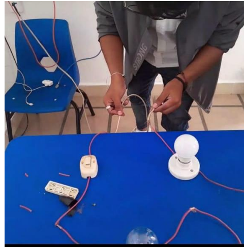
Se realizo en un circuito en serie.