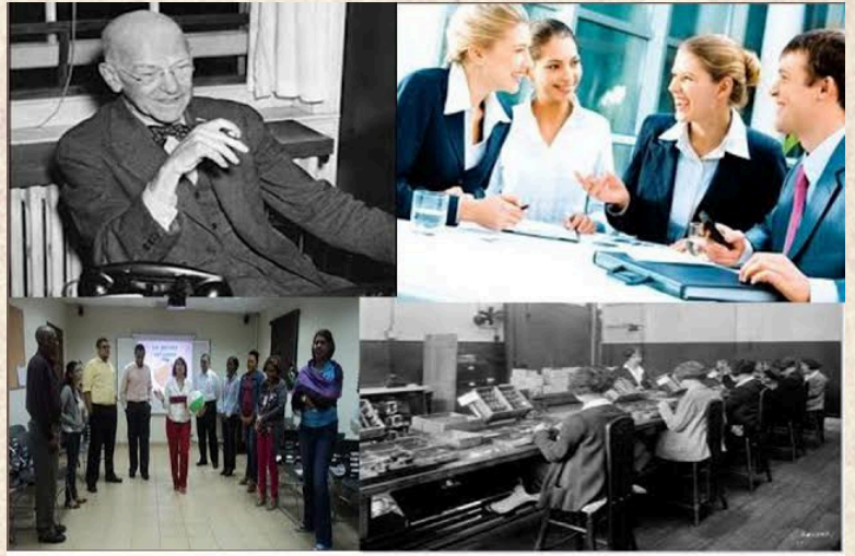
Escuela de las relaciones humanas

Es una corriente administrativa creada en la década de 1930 por el sociólogo y psicólogo Elton Mayo, cuyas ideas se oponían a las teorías de la administración clásica (Henry Fayol) y científica (Frederick W. Taylor).