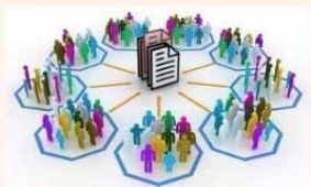
Diagrama de flujo

Son considerados uno de los elementos más eficaces para la toma de decisiones en la administración, ya que facilitan el aprendizaje y proporcionan la orientación precisa que requiere la acción humana en cada una de las unidades administrativas que conforman a la empresa