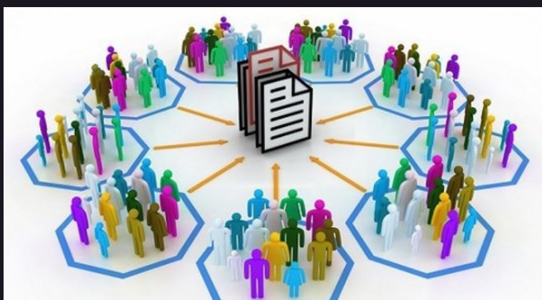
DIAGRAMA DE FLUJO