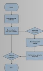
DIAGRAMA DE FLUJO

Diagrama que describe un proceso, sistema o algoritmo informático.