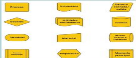
Diagrama que describe un proceso, sistema o algoritmo informático.

Emplean rectángulos, óvalos, diamantes y otras numerosas figuras para definir el tipo de paso, junto con flechas conectoras que establecen el flujo y la secuencia.