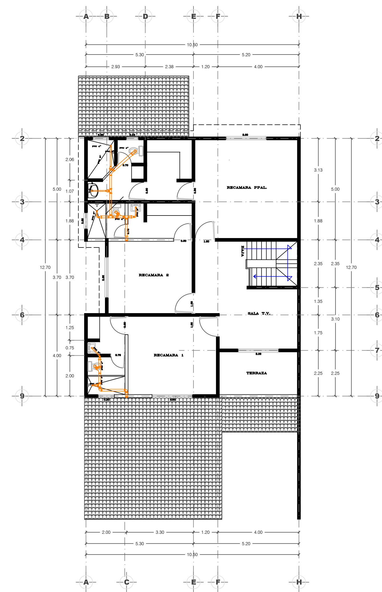
INSTALACION SANITARIA PLANTA ALTA ESC. 1: 100