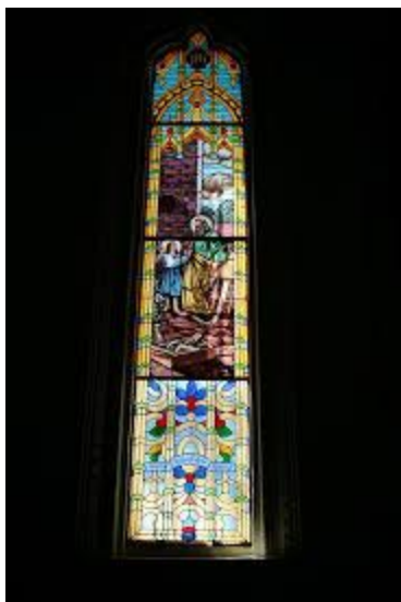
Tres vanos de ventana con arco trilobulado moldurado con vitrales