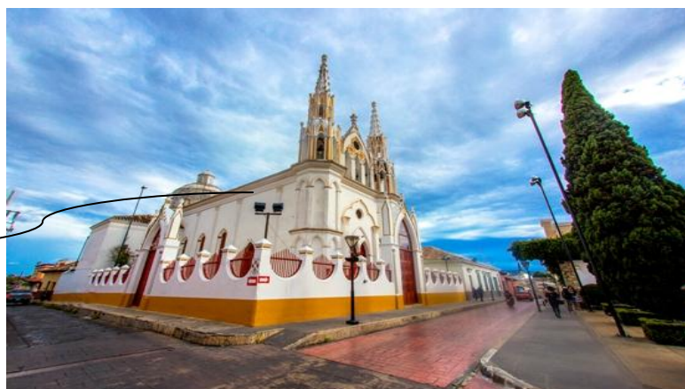
Un entablamento con cornisa denticulada corre alrededor del templo