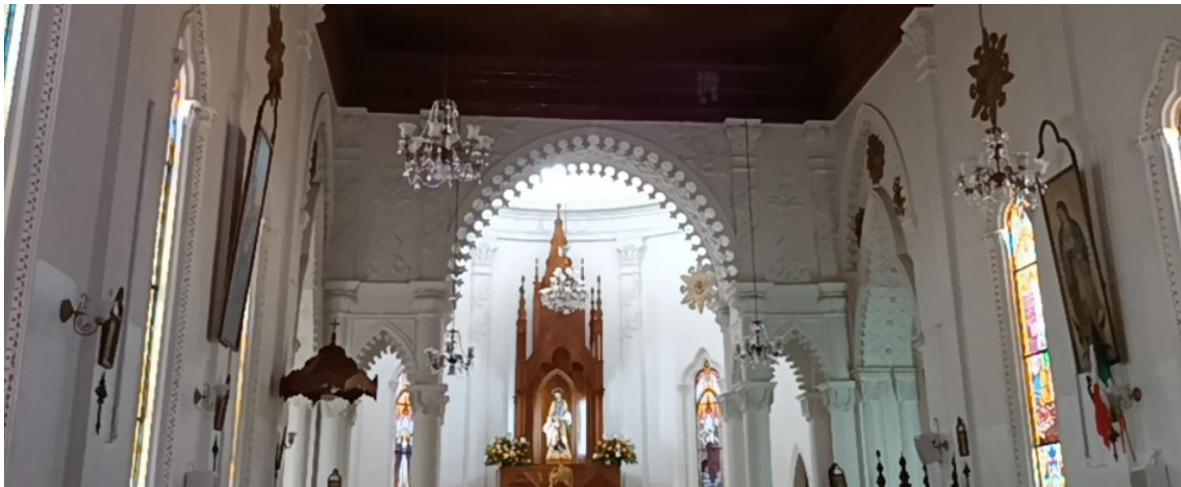
ARCO DE MEDIO PUNTO