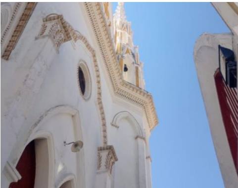
PILASTRAS ADOSADAS CON FUSTE LIZO