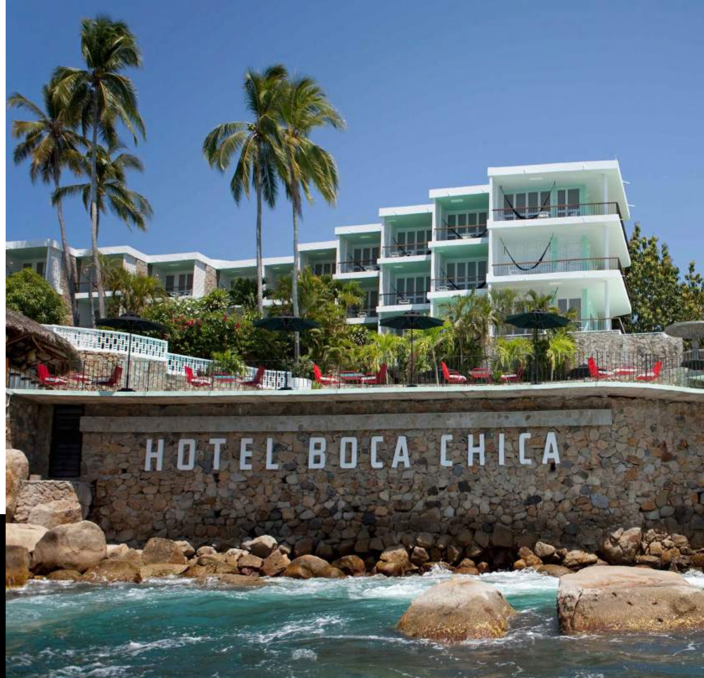
01: Hotel boca chica.