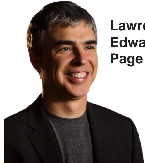
Lawrence Edward Page

•CARACTERÍSTICAS DEL EMPRENDEDOR FORMACIÓN: YALE UNIVERSITY BA