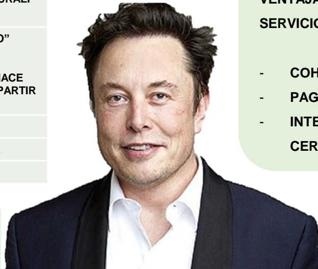
Elon Reeve Musk