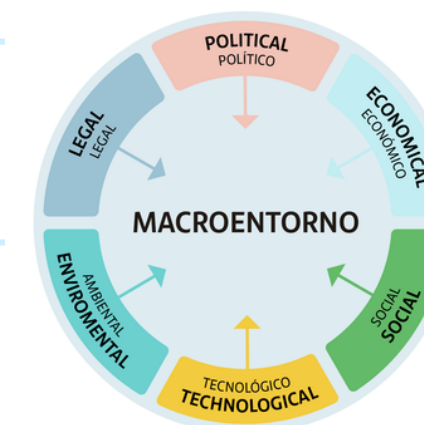
¿Qué factores determinan el macroentorno?

Son genéricos y existen con independencia de que se produzcan o no intercambios. Su influencia no se limita a las actividades comerciales y su microentorno, sino también a otras muchas actividades humanas y sociales.