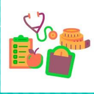
Mini nutritional assessment