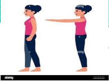
Prueba de Rombery Balnce test