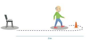
El té timed up and go test