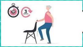
Test de equilibrio unipodal