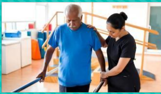
Test de Tinetti