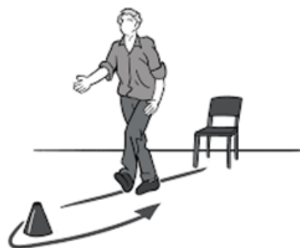
timed up and go