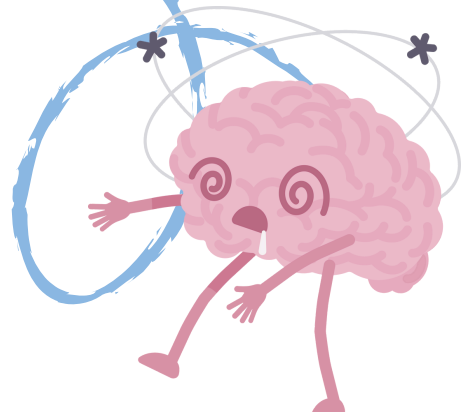
DSM IV TR