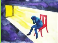
ESCALA DE BECK