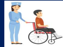
INDICE DE BARTHEL