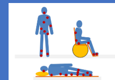
ESCALA DE NORTON