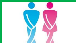
TEST 3 10