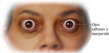
Ojos saltones y enrojecidos.