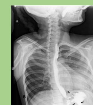
Esofagografía con bario

Se lleva a cabo mediante la clínica del paciente y mediante las siguientes pruebas