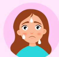
Sofocos del embarazo

SON CAUSADOS POR CAMBIOS EN LOS NIVELES HORMONALES, EN PARTICULAR LA DISMINUCIÓN DE LOS NIVELES DE ESTRÓGENO DURANTE LA MENOPAUSIA. AUNQUE SON MÁS COMUNES DURANTE LA MENOPAUSIA, TAMBIÉN PUEDEN OCURRIR EN OTRAS SITUACIONES