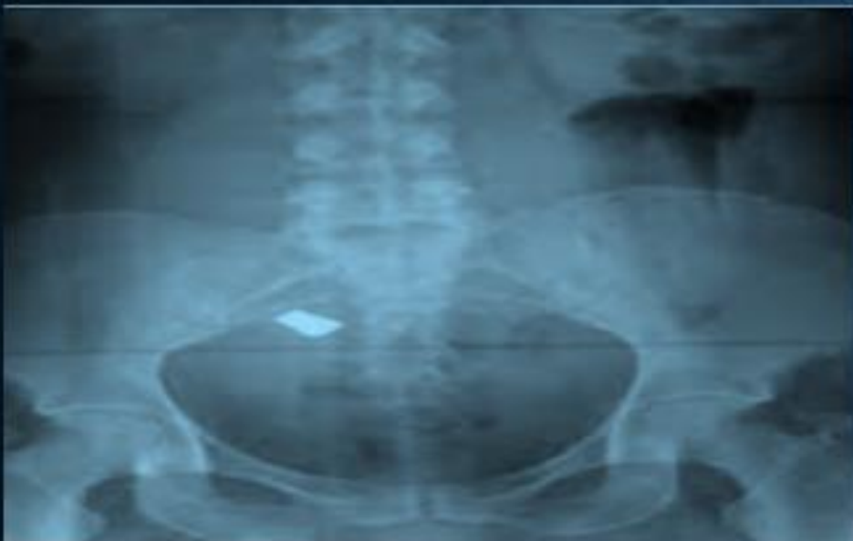
IMAGEN 5: RADIOGRAFÍA ABDOMINOPÉLVICA.