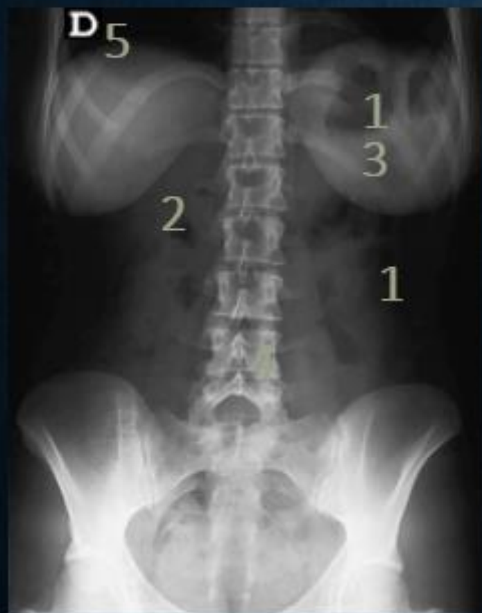
IMAGEN 2: RADIOGRAFÍA DE ABDOMEN.