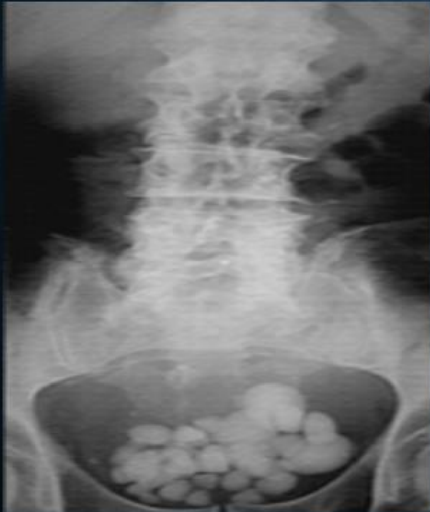
IMAGEN 3: RADIOGRAFÍA ABDOMINOPÉLVICA.