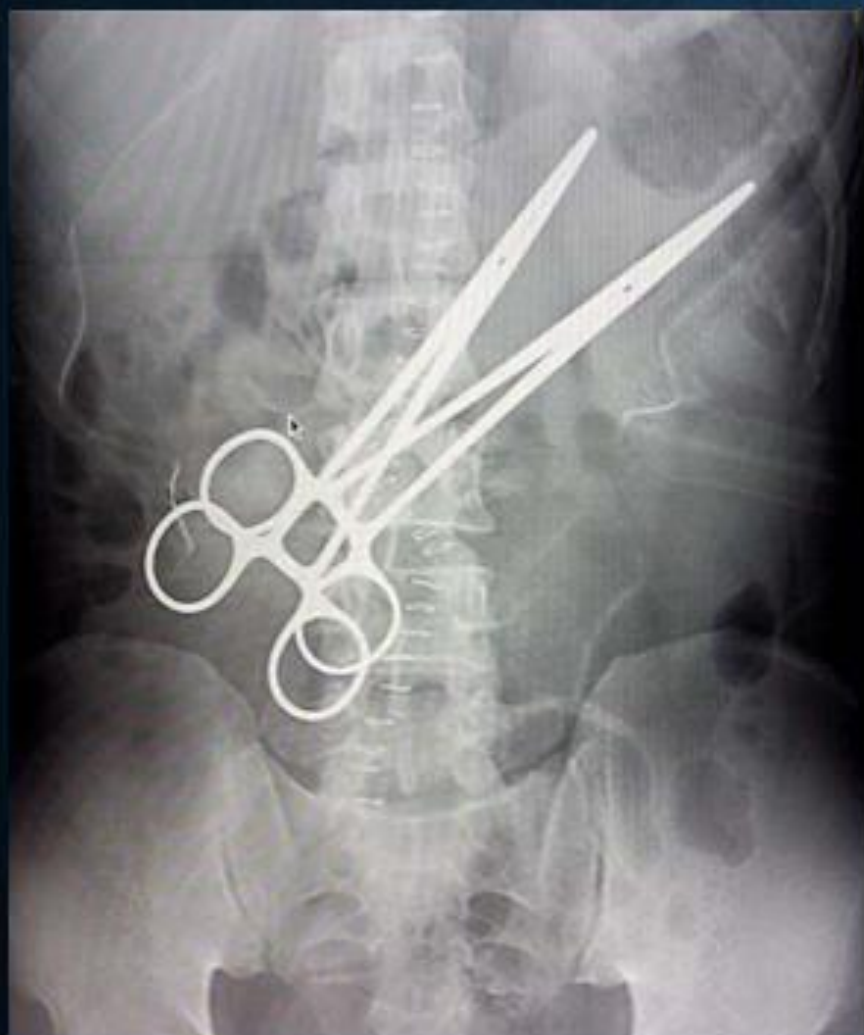
IMAGEN 1: RADIOGRAFÍA ABDOMINOPÉLVICA.