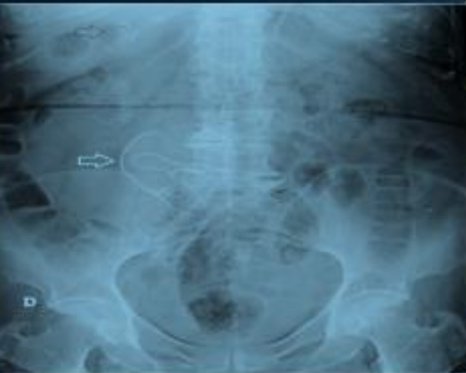
IMAGEN 4: RADIOGRAFÍA DE ABDOMEN.