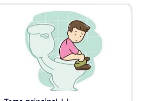
Tema principal 1 1