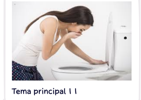
Tema principal 1 1