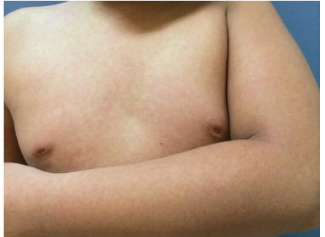
Figura 112-1. Dengue, lesiones diseminadas.