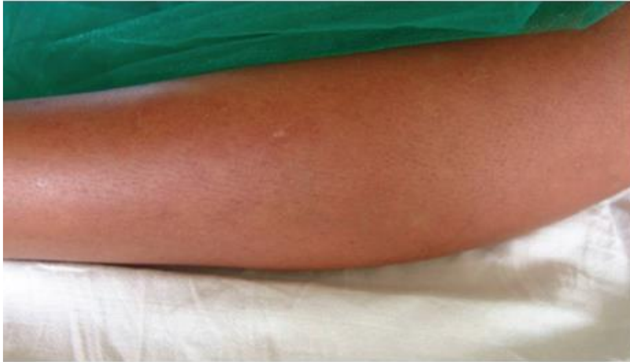
▲ Figura 112-3. Dengue hemorrágico, erupción maculopapular.