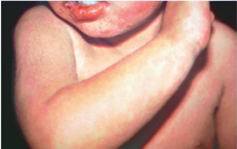
Sarampión en un preescolar

Enfermedad viral aguda y contagiosa, que se transmite por la propagación de microgotas o el contacto directo con secreciones nasales o faríngeas.