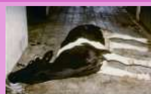
Figura 1. MSUD Ternera Fidei Harford de 5 días de edad en decúbito lateral con anemiasis dorsocentral; nudo de madero; nudo e cólicos NP 21

Tratamiento: Antibióticos parenterales, suero, sedantes y relajantes musculares