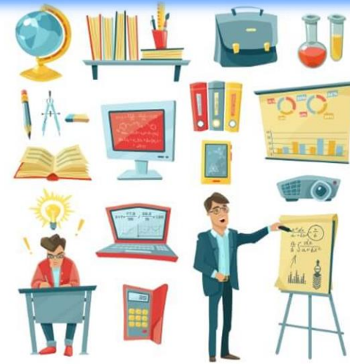
Plan de estudios que contiene los objetivos, contenidos, materiales y estrategias de enseñanza

Documento teórico que marca las bases de cada una de las materias, así como los objetivos que deben cumplir los alumnos para que finalicen los cursos académicos suficientemente preparados.