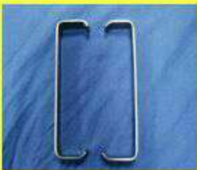
Separador de farabeuf.

EXPOSICIÓN: Por medio de este proceso se retira una sección o la parte del organismo.