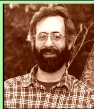
Father of the spreadsheet.