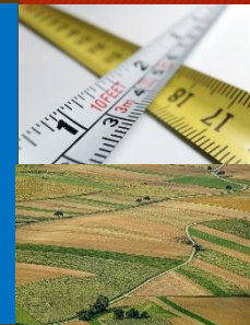
Figura que tiene lugar cuando los limites que separan un predio de otro u de otros no se han fijado, o cuando habiéndose fiado, existe motivo fundado para creer que no son exactos, ya sea porque se confundieron, porque se destruyeron las señales que lo marcaban, o porque se colocaron en un lugar distinto al original.