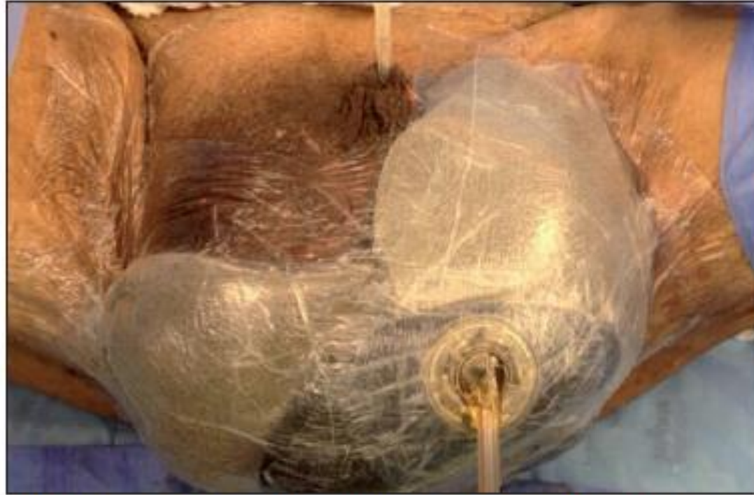
Fig. 11. Caso 3. Sistema VAC® comprendiendo la región perineal y las dos bolsas escrotales. Caso 3. Curativo a vacío tipo VAC® com esponja de prata adaptado a região perineoescrotal.