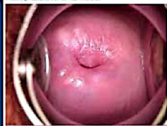
FIGURA 2. SIGNOS DE LA COLPOSCOPIA