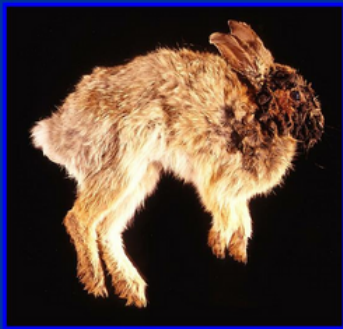
PAPILOMATOSIS DEL CONEJO