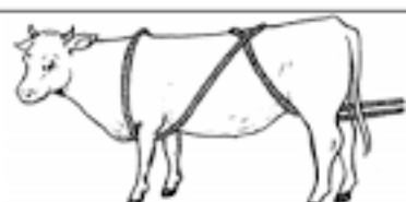
Método de volteo sencillo