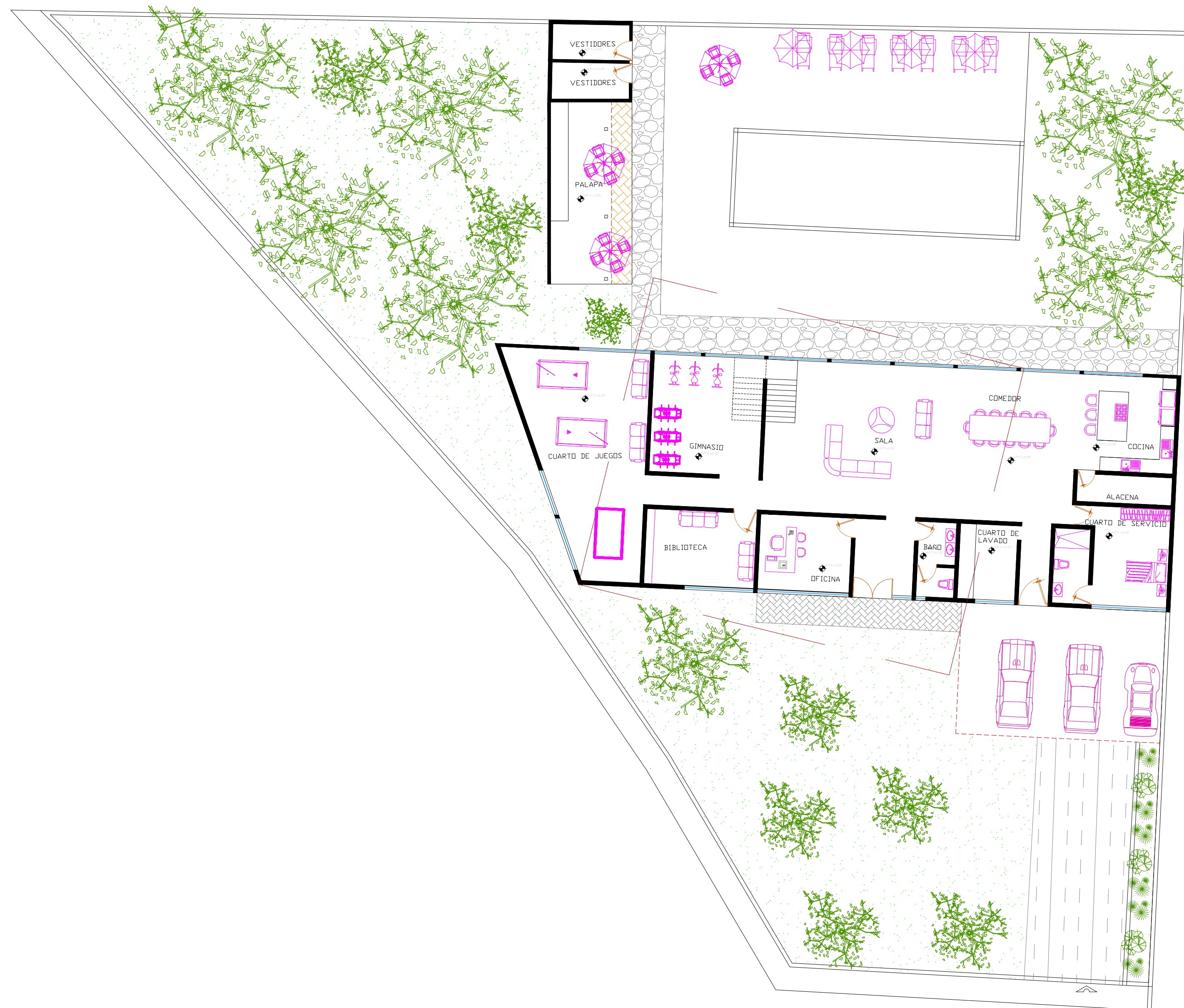
PLANTA ARQUITECTONICA BAJA