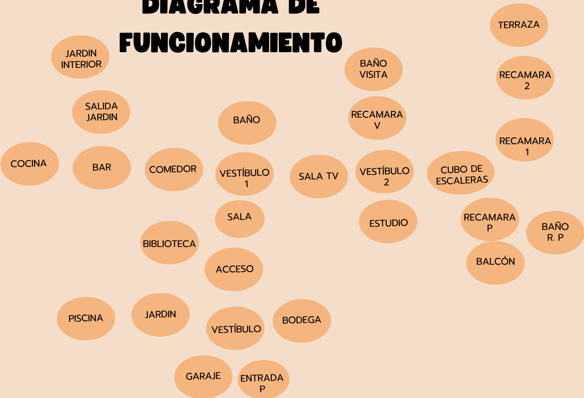
DIAGRAMA DE FUNCIONAMIENTO