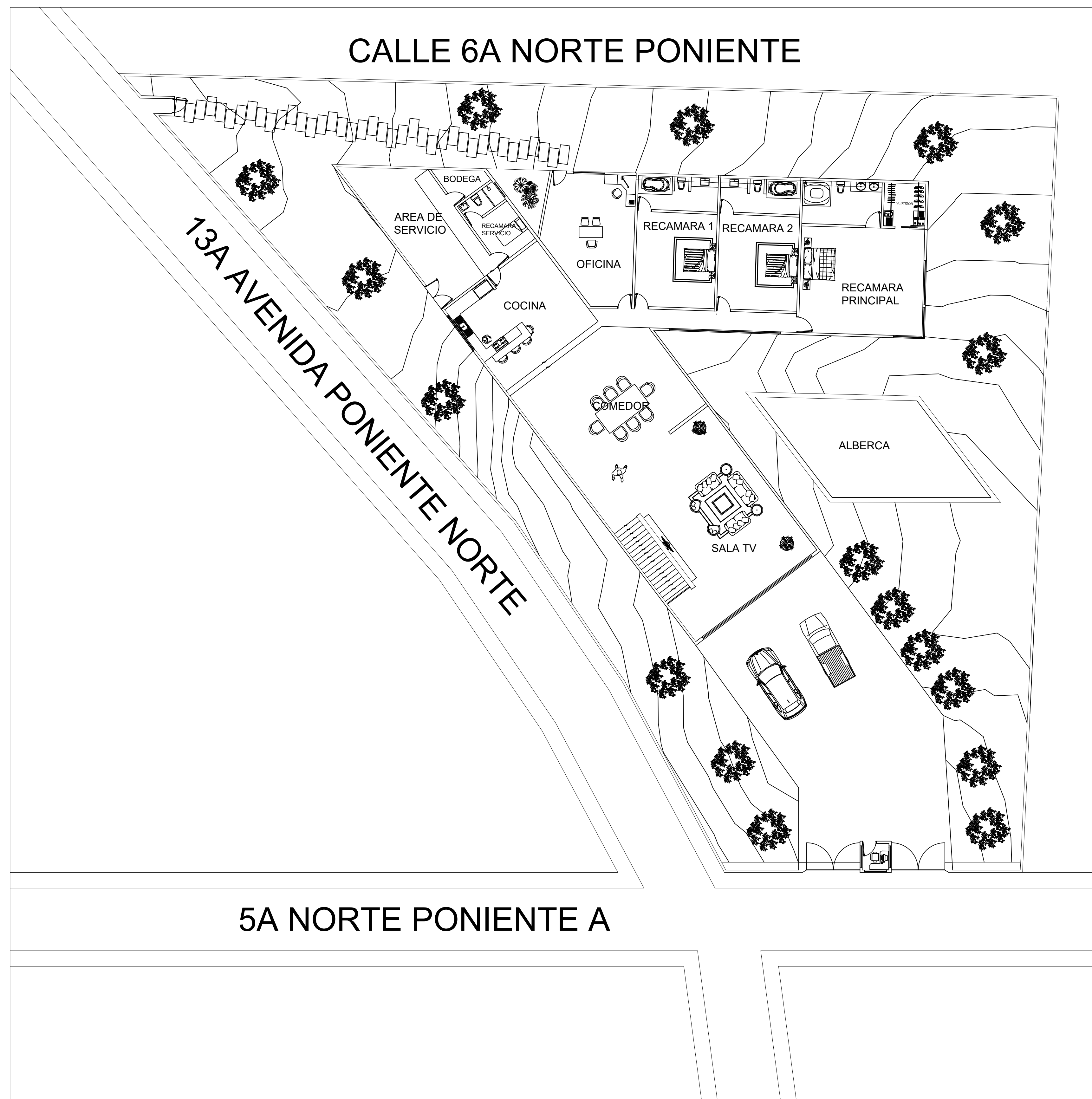
PLANTA ARQUITECTONICA ESC.....1:200