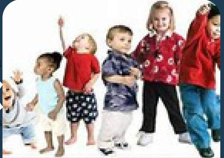
Desarrollo psicomotriz del niño

Corresponde tanto a la maduración de las estructuras nerviosas (cerebro, médula, nervios y músculos...) como al aprendizaje que el bebé -luego niño- hace descubriéndose a sí mismo y al mundo que le rodea.