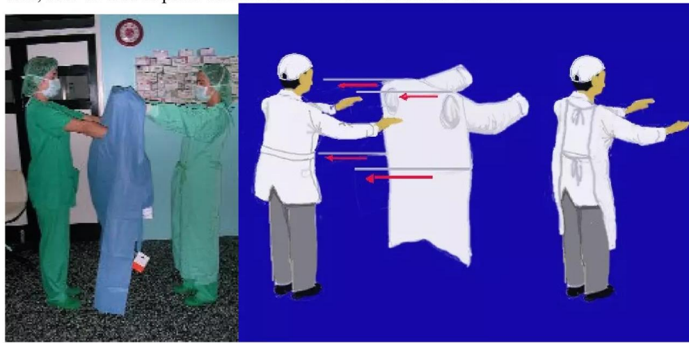
Colocación de bata a otra persona