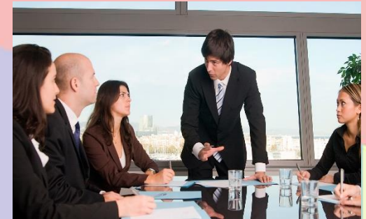
Imagen interna: Es todo lo relacionado con el ser interior. Es un viaje a lo interno de sí mismo, tener claro sus objetivos

Imagen Física o Corporal: Corresponde a todo lo relacionado con la apariencia, la presentación personal, con lo externo.