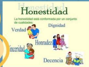
Honestidad La honestidad está conformada por un conjunto de cualidades: Verdad Dignidad Honestidad Honradez Incertidumbre Decencia