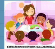
ESTRATEGIAS DE ENSEÑANZA/APRENDIZAJE